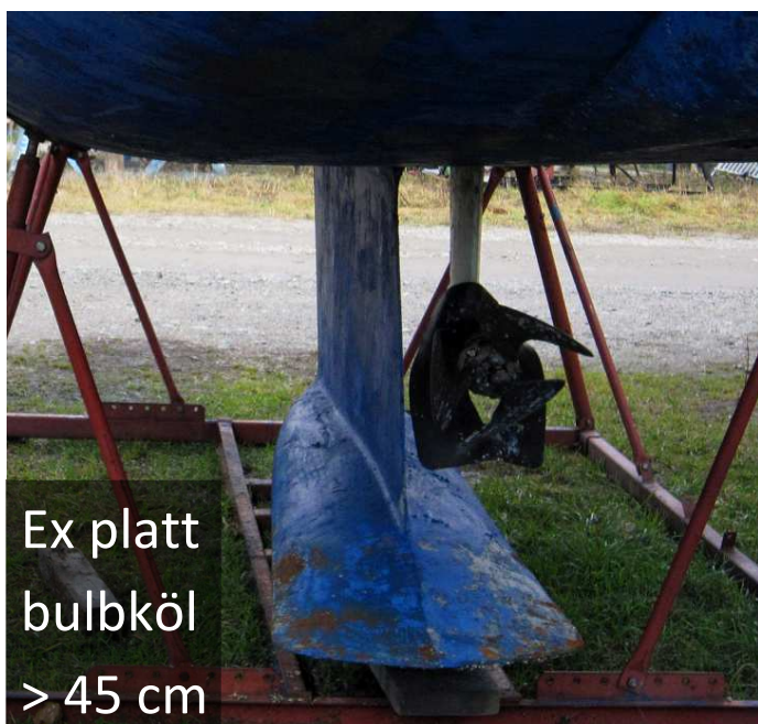
Ex platt bulbköl > 45 cm