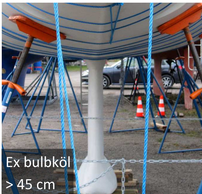
Ex bulbköl > 45 cm

Segelbåtar med vingköl, bulb formationer bredare än 45 cm, eller med köl-/fenformationer utanför skrovets centrumlinje.